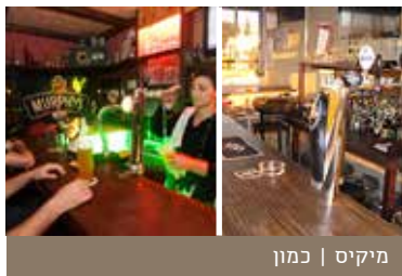
מיקים | כמון

ברים, חוויה אחרת | תרשיחא | טלפון: 054 5202332 | 04 8446649