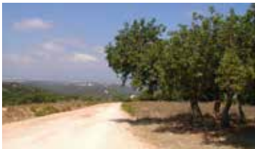
דרך נוף הילה-מנות