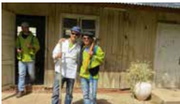
תיירות כפר מסריק