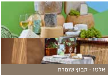
אלטו - קבוץ שומרת

מחלבת אלטו הנה מחלבת בוטיק כפרית ומשפחתית. סיפור אהבה בלבן: אהבה למלאכת הגיבון, והיצירה. באלטו מייצרים את הגבינות מחלב עזים גלילי משובח, בשיטות עבודה מסורתיות, המקובלות באזורים הכפריים באירופה, לצד דייקנות ושמירה על תנאי היגיינה גבוהים. דגש על קו בריאותני לצד גבינות גורמה העשירות. באלטו מבחר גבינות בשלות קרמיות בעלות טעם משובח. גבינות עובש לבן מסוג ברי וקממבר, סנט מור וכרמל בלו המאופיינת בעורקים כחולים המפתחים ניחוח וחרירות עזים. סמדר - פיתוח ייחודי של מחלבת אלטו. מצופה בפחם ומפתחת טעם עשיר וייחודי. לאלטו קולקציה עשירה ומגוונת של גבינות קשות וחצי קשות בנוסחים שונים: תום-גבינה חצי קשה בניחוח וטעם עשיר ממחוזות מזרח צרפת. מונטסיו בטעם עדין ומיוחד, גאודה קרמית בעלת טעם עשיר ומתקתק, קפרינלה, גבינה קשה בעלת ארומה וטעם נפלאים ועוד.