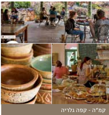
קמ"ה - קפה גלריה

קמ"ה - קפה גלריה | הרדוף | טלפון: 04-9059338