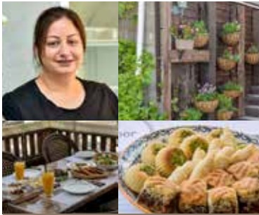
נור - Noor

Noor - בית קפה ומסעדה דרווית אותנטית | ג'וליס | טלפון: 050-6522280/04-6293460