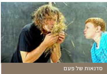
סדנאות של פעם

[לפרטים נוספים ותיאום: 052-8391797 | www.omanya.co.il ]