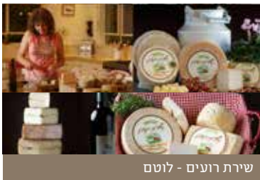
שירת רועים - לוטם

מחלבת שירת רועים הינה מחלבת בוטיק, המייצרת גבינות איכותיות מחלב צאן [עזים וכבשים]. במחלבה מיוצרות גבינות קשות, חצי קשות, חצי רכות ורכות, בשיטות מסורתיות הנהוגות באירופה - ללא חומרי שימור, ללא צבעי מאכל או ציפויי שעווה. מיכל מור מלמד, גבנית המחלבה, היא קלינאית תקשורת ותיקה שנחשפה לעולם הגבינות באקראי, במהלך חופשת רחיצה במצנחים באלפים הבריטיים בשווייץ. בשנת 2005 היא יצאה לשווייץ עם קבוצת מצנחי הרחיפה אולם מזג האוויר לא שיתף פעולה. לכן יצאה מיכל לראות כיצד מכינים גבינות קשות בהרים בשווייץ-והתאהבה. היא חזרה לארץ, למדה את נושא הגבינות והחלב במדרשת רופין, עבדה במספר מחלבות בארץ ואף נסעה לשווייץ לייצר גבינות. היא הקימה מחלבה וכיום היא חברת כבוד בגילדת הגבנים העולמית וגבינותיה יצגו את ישראל באליפות העולם לגבינות וזכו במדליות. לאחר 9 שנות ייצור ויצירה בקיבוץ רשפים, עברה המחלבה ללוטם ובצמוד לה הוקם "בית לגבינות" - מקום שמספק חוויה שלמה למבקר המתעניין בגבינות ארטיזנליות. במקום ניתן לצפות בתהליכי הייצור וההבשלה, לטעום ולקנות את גבינות המחלבה, לשמוע את סיפור המחלבה, לצפות בסרטון המחלבה, להשתתף באירועים ובסדנאות ולהתענג על גבינות המחלבה ועל תוצרת גלילית משובחת. גבינות המחלבה כשרות - בהשגחת המועצה האזורית משגב-הרב עוזיאל אליהו.