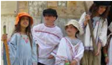
תיירות כפר מסריק