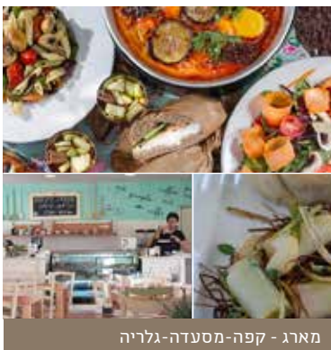
מארג - קפה-מסעדה-גלריה

קפה מארג - קפה מסעדה | רח' מירון 1, כפר ורדים | טלפון: 04-9971369